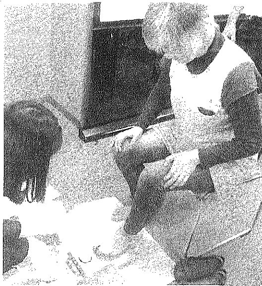
(アウラ... しごとく 生きのびるかな?)

5月9日(火)主婦の会は「歩き」のトラブルをテーマに、健康教室を東久留米市役所で開催しました。3名の主婦の